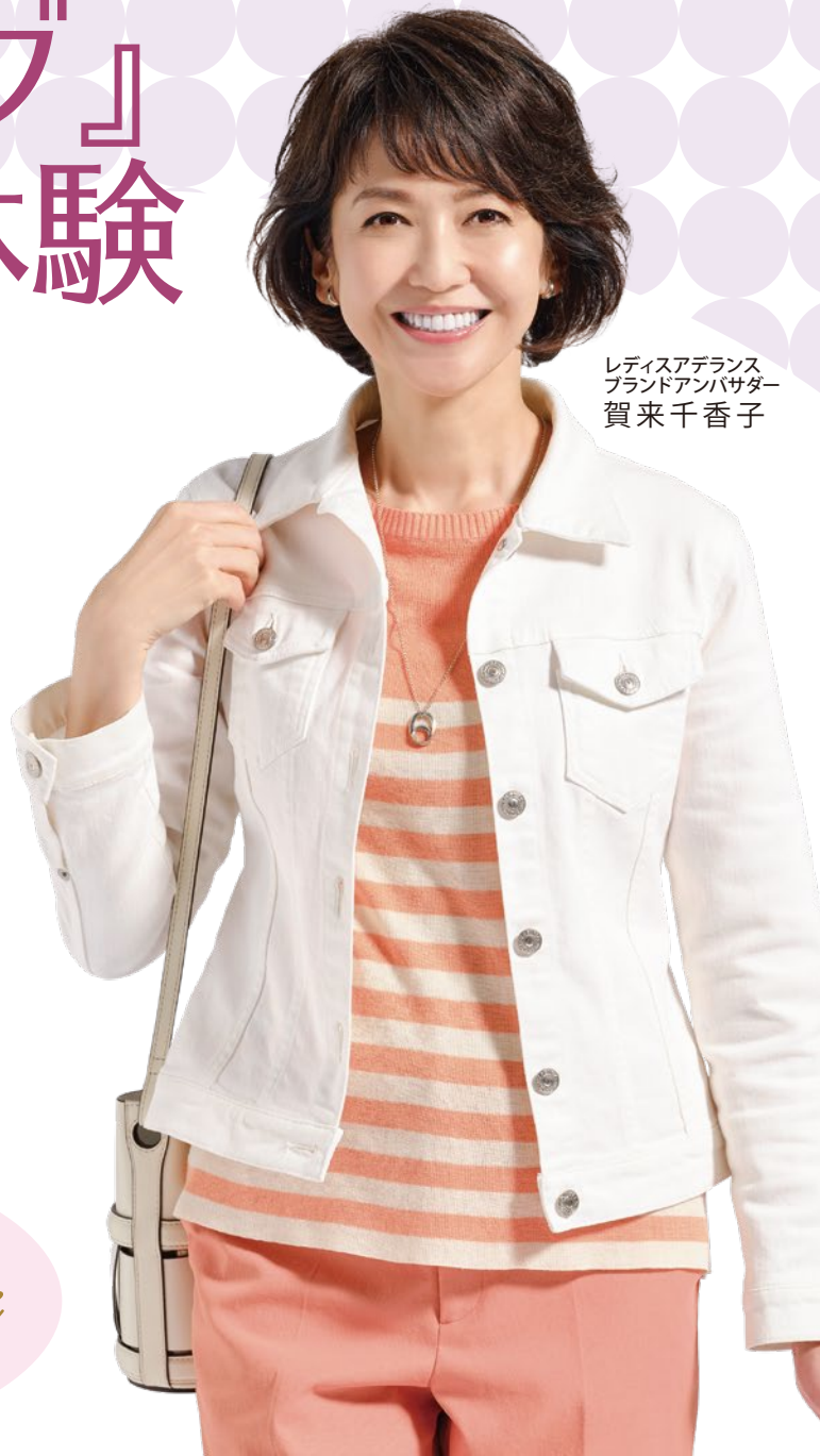
レディースアデランス ブランドアンバサダー 賀来千香子