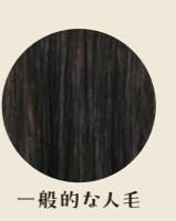
サイバーエックス 一般的な人毛