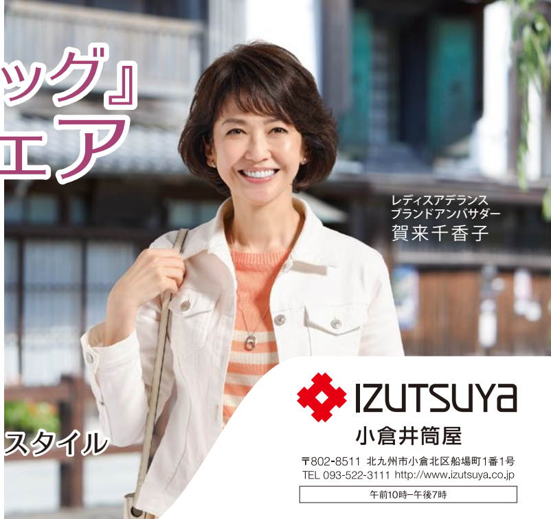
レディースアデランス ブランドアンバサダー 賀来千香子